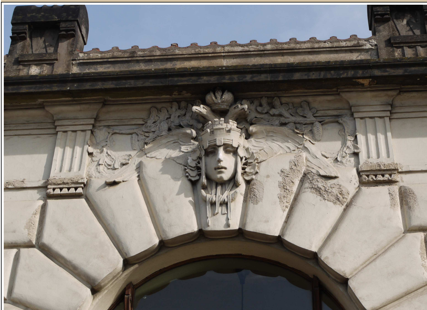
maskaron v klenáku okna stav v roce 2017